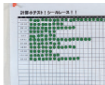
【生徒全員の進捗表】

学習単元が終わるごとに、毎回チェックテストを行います。合格者は次の単元の学習に進みますが、不合格者は見つかった課題を復習して再挑戦。このように、必ず学習の定着度を定期的に確認します。また、教室には生徒全員の進捗表があり、合格単元にシールを貼って、成果を見える化。