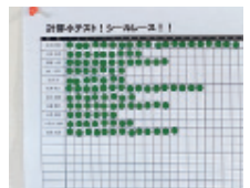
【生徒全員の進捗表】

学習単元が終わるごとに、毎回チェックテストを行います。合格者は次の単元の学習に進みますが、不合格者は見つけた課題を復習して再挑戦。このように、必ず学習の定着度を定期的に確認します。また、教室には生徒全員の進捗表があり、合格単元にシールを貼って、成果を見える化。